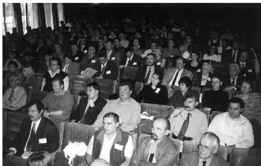
A nagyszámú hallgatóság végig figyelmesen követi az előadásokat